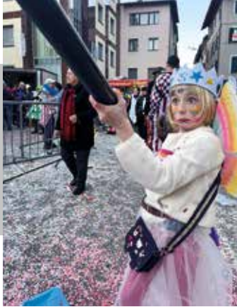
Dall'8 febbraio al 15 marzo, ogni fine settimana c'è festa nelle Tre Valli (p. 5)